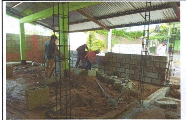
Foto 4: Mejoramiento de cerramiento y puerta de instalación de ambiente de párvulos 2, sección B

Observación: Si es necesario se pueden agregar hojas adicionales y actualizar el número de hojas.